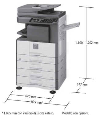
*1.085 mm con vassoio di uscita esteso. Modello con opzioni.